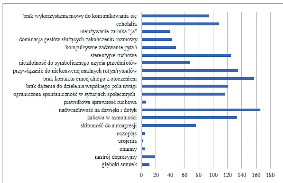
Wykres 2. Odpowiedzi na temat charakterystycznych cech osób z zaburzeniami ze spektrum autyzmu

w utrzymaniu koncentracji, niemożność skupienia uwagi na wykonywanych czynnościach, a także impulsywność, nadpobudliwość ruchową i nadmierną ruchliwość. Rzadziej wymieniane była nieumiejętność zabawy i brak zainteresowania zabawkami, wybiórczość pokarmowa i nieużywanie zaimka „ja”. Niektórzy z udzielających odpowiedzi nie potrafili wymienić trzech objawów zaburzeń ze spektrum autyzmu, jednak był to niewielki odsetek biorących udział w badaniu – 6 osób. Brak gestu wskazywania palcem, niewykonywanie poleceń, obniżenie sprawności intelektualnej, wysoka inteligencja, deficyty w zakresie teorii umysłu, problemy z postrzeganiem dobra i zła oraz wpadanie w otępienie to objawy, które zostały wymienione jednokrotnie.