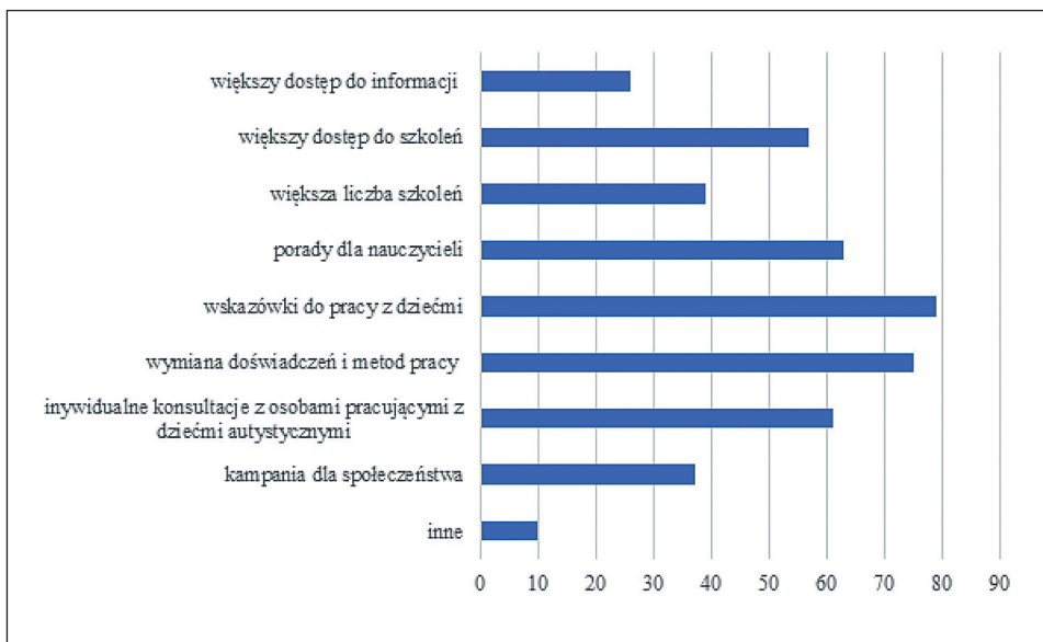
Wykres 4. Rodzaj oczekiwanego wsparcia nauczycieli w pracy z dziećmi z ASD

53% nauczycieli nie czuje się w ogóle przygotowanych do pracy z dzieckiem autystycznym, natomiast 47% z nich sądzi, że są przygotowani albo też, jeśli obecnie nie mają do czynienia z dzieckiem ze spektrum autyzmu, to ich wiedza wystarczy do dalszej pracy dydaktycznej.